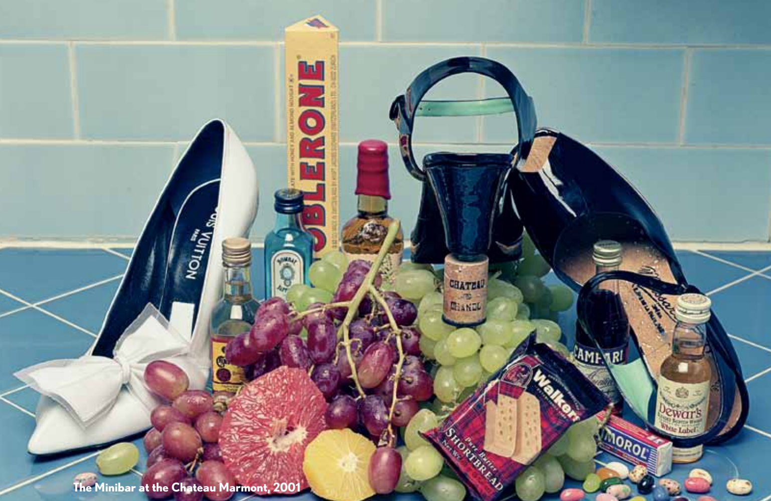
The Minibar at the Chateau Marmont, 2001