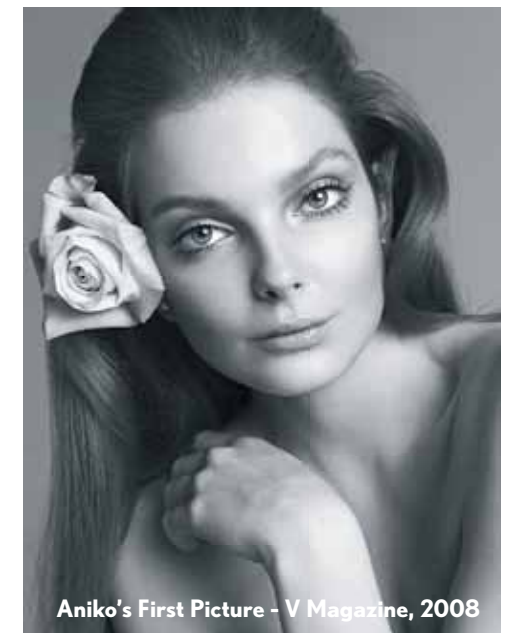
Aniko's First Picture - V Magazine, 2008

Inez van Lamsweerde (1963) studeerde aan de Rietveld Academie in Amsterdam. In 1992 zat ze een jaar als artist in residence in P.S.1 in New York. Samen met Vinoodh Matadin (1961), afgestudeerd modeontwerper, groeiden ze uit tot een onafscheidelijk duo. Als een van de eersten experimenteerden ze met digitale manipu- latie. Hun internationale doorbraak kwam in 1994 met een publicatie in het Britse maandblad The Face . Inmiddels behoren ze tot de top in de modefotografie, met Vogue , V Magazine en The New York Times als op- drachtgevers. Ook in de celebrityfotografie maken ze naam met iconische portretten van Karl Lagerfeld, Kate Moss en Madonna. Hun fotografie is in vele musea tentoongesteld, hun werk wordt verkocht bij Matthew Marks Gallery in New York.