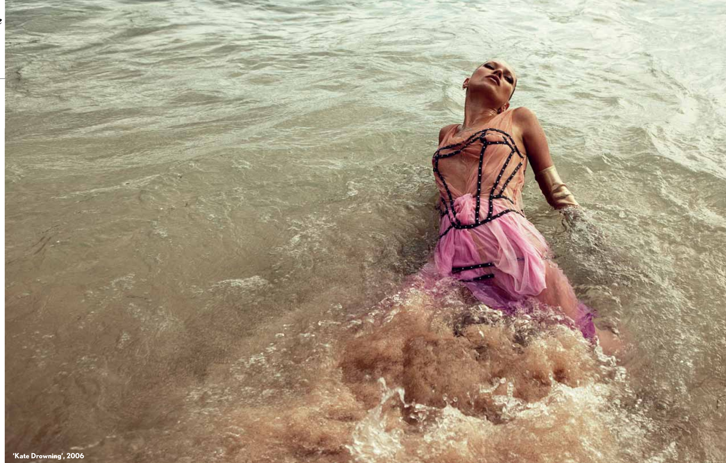
'Kate Drowning', 2006

Hij had gelijk. Ons verhaal geeft aan wat voor stad New York is: een werkende stad. Iedereen is hier met een doel. Iedereen is bezig iets voor